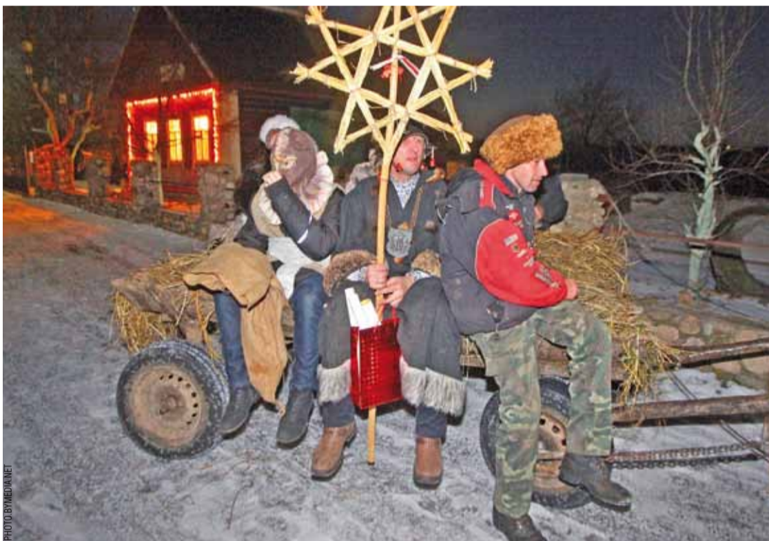
Калядаванне ў мястэчку Бобр (Крупскі раён).

Старая Беларусь пакінула нам толькі фрагменты сваёй велічы. Анонс новага праекта фатографа «НН» Сяргея Гудзіліна аб беларускіх брукаванках. Просьба да чытачоў: калі вы ведаеце месцы, дзе захаваліся аўтэнтчныя брукаванкі, паведаміце ў Рэдакцыю іх знаходжанне. Пазначце лепш раён і вёску, мястэчка ці хутар, ля якога яна знаходзіцца. Гэтым вы ясна паспрыяеце фотапраекту, які пабачыце ў новым 2012 годзе на старонках «Нашай Нівы».