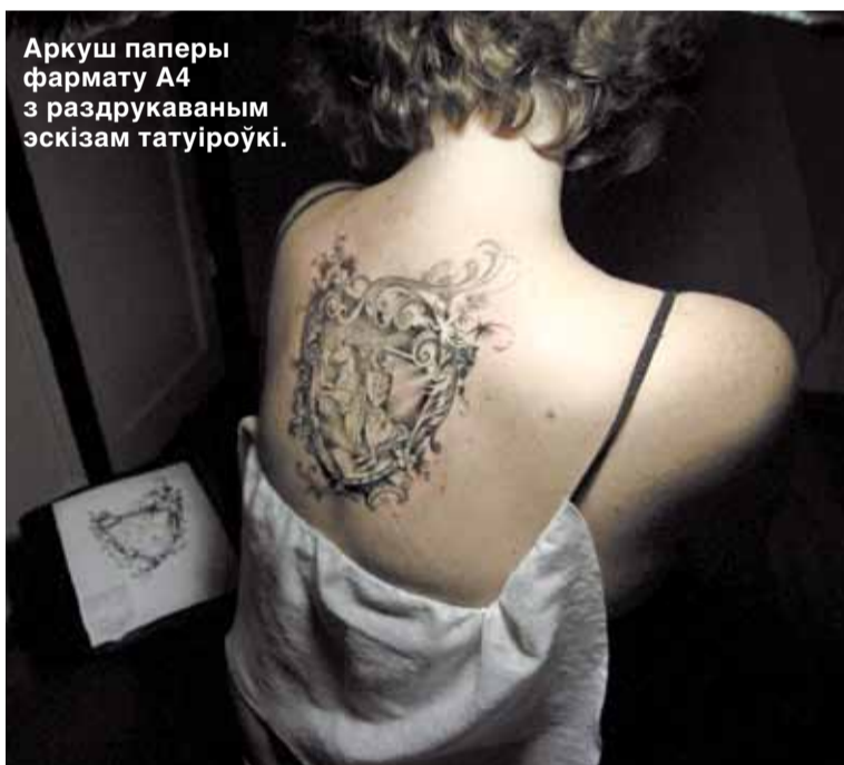
Аркуш паперы фармату А4 з раздрукаваным эскізам татуіроўкі.