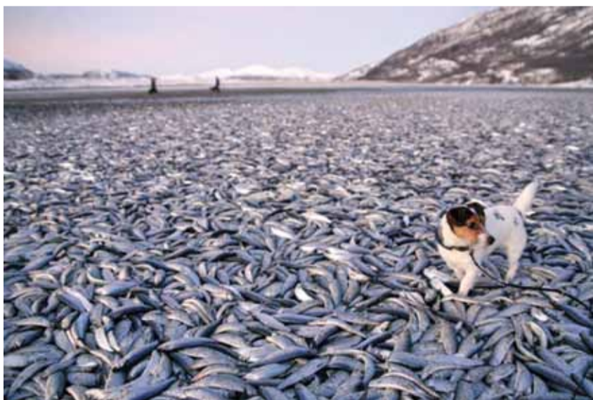
2 студзеня дзясяткі тысяч дохлых сяляццоў запаланілі пляж у раёне горада Квенес на поўначы Нарвегіі. На думку навукоўцаў, выкінуцца на бераг 20 тонаў сяляццоў прымусіла зграя драпежных рыб або магутны шторм, але ад больш канкрэтных версій эксперты адмаўляюцца.

Дзвінск. У ваенным складзе Дзвінскай крэпасці выкрылі немалую крадзежу салдацкай адзежы. Крадзежа тым больш цікавая, што гэтыя склады ўдзень і ўночы вартуюць салдаты з вінтоўкамі ў руках. «НН». №1. 1912. Новы 2002 год для еўрапейскай інтэграцыі адзначыўся ўвадзеннем адзінай наўнай валюты — еўра. Дагэтуль Еўрасаюз быў у асноўным справай палітычна-бюракратычных ды фінансава-эканамічных элітаў, але з увадзеннем агульнаеўрапейскіх грошай ён надзвычай блізка падышоў да шараговых грамадзянаў ЕС, якія дагэтуль больш лічылі сябе грамадзянамі асобных краінаў, чым еўрапейцамі. «НН». №1. 2002.