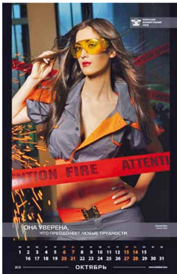
Работніцы Беларускага металургічнага зняліся для эратычнага календара. Календар прызначаны для маркетынгавых мэтай і будзе распаўсюджаны сярод дзелавых партнёраў завода.