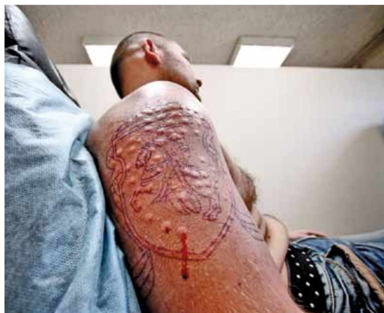
Пухіры ад анестэтыкаў у кліента мінскага тату-салона. Плошча тату пакрываецца коркай ад параненых капіляраў — як у дзяцінстве ад падзення на асфальт.