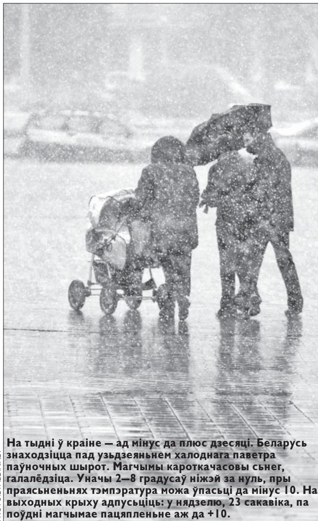
На тыдні ў краіне — ад мінус да плюс дзесяці. Беларусь знаходзіцца пад узьдзеяннем халоднага паветра паўночных шырот. Магчымы кароткачасовы сьнег, галалёдзіца. Уначы 2—8 градусаў ніжэй за нуль, пры праясьненьнях тэмпература можа ўпасці да мінус 10. На выходных крыху адпусьціць: у нядзелю, 23 сакавіка, па поўдні магчымае пацяпленне аж да +10.

Паводле БелаПАН , «Звязда», радыё «Рацыя», BulletinOnline.org , «Рэспубліка», БЕЛТА , СТВ