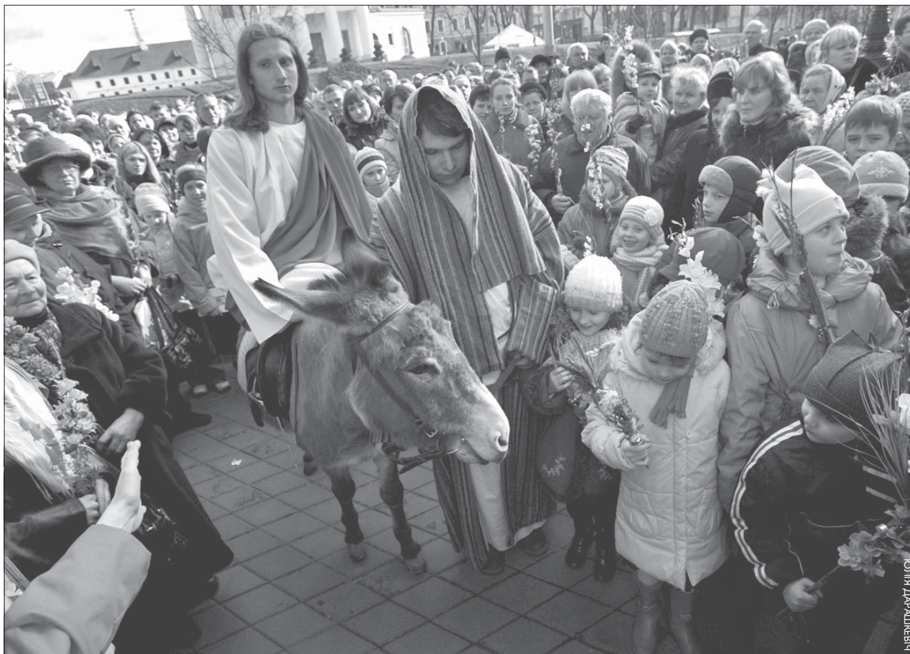
Хрыстос на Плошчы Свабоды. З гэткай інсцэніроўкай менскія каталікі ў нядзелю сьвяткавалі Вербіцу.