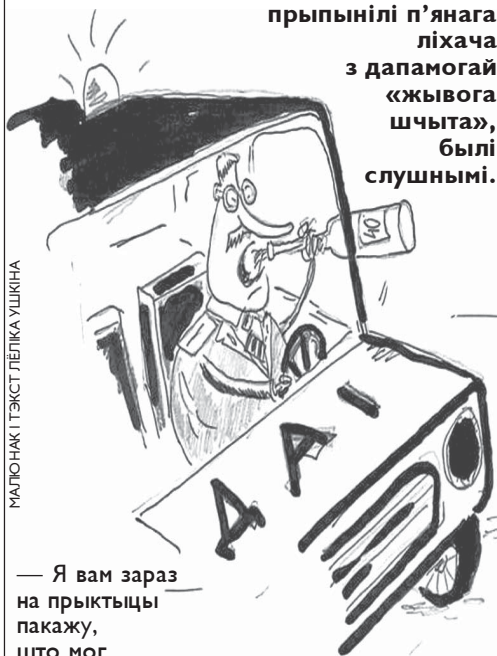
МАЛО НАКІТЭКСТ ЛЕБІКА УШКІНА

...МУС настойвала на тым, што дзеяньні ДАІ, якія прыпынілі п'янага ліхача з дапамогай «жывога шчыта», былі слухнымі.