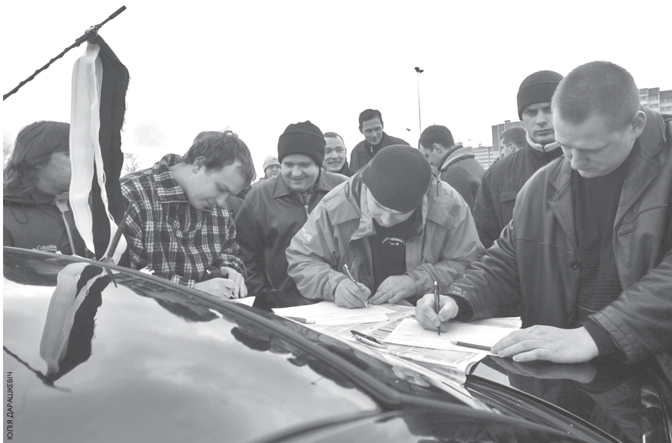
15 сакавіка да гіпэрмаркету ProStore прыехалі некалькі дзясяткаў аўта, аздобленых белымі і чорнымі стужкамі, а таксама плякатамі і налעпкамі з надпісам «Жывы шчыт». Аварыя, якая ўзбунтавала кіроўцаў — старонка 18.