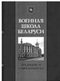
Ваенная школа Беларусі: Традыцыі і сучаснасць. — Мінск: «Беларуская Эцыклапедыя», 2010. 2000 ас.

Выдавецтва «Беларуская Эцыклапедыя імя Петруся Броўкі» выдала кнігу «Ваенная школа Беларусі: традыцыі і сучаснасць».