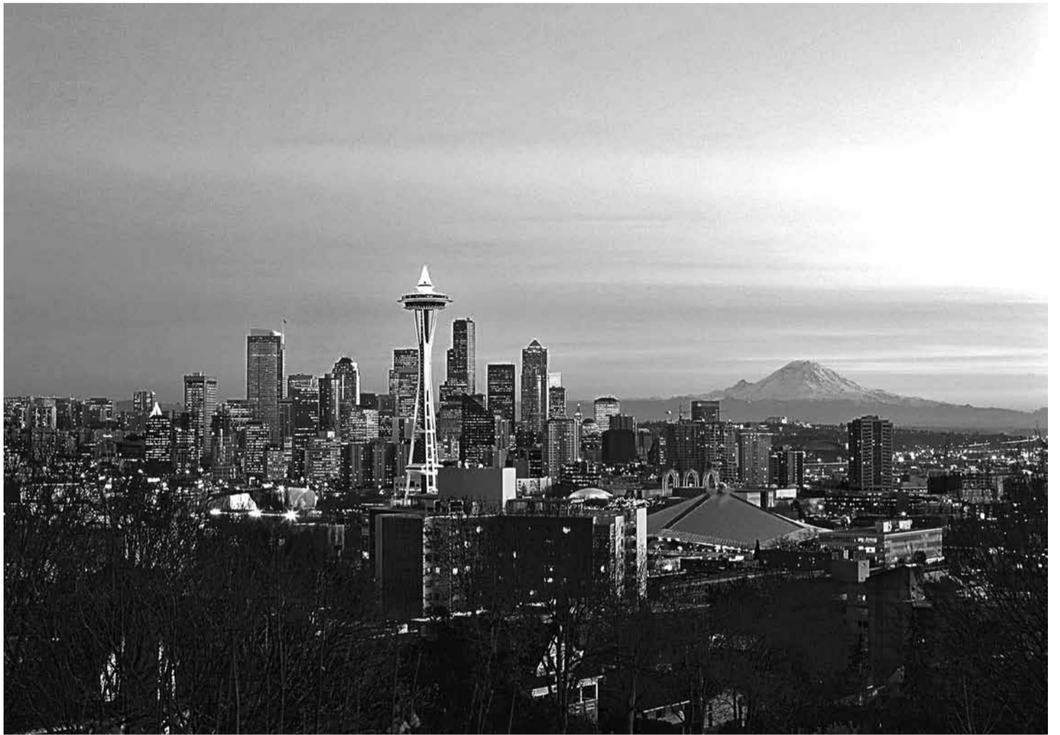
Сіэтл у прыцемку выглядае незямным горадам.

За колькі кварталаў ад Леніна знаходзіцца мост (якая іронія!) «Аўрора». Ён абнесены высачэзнымі агароджамі. Справа ў тым, што «Аўрора» — другі па папулярнасці сярод самагаўцаў мост у ЗША. Больш суіцыдаў здараецца толькі на «Залатых варотах» у Сан-Францыска.