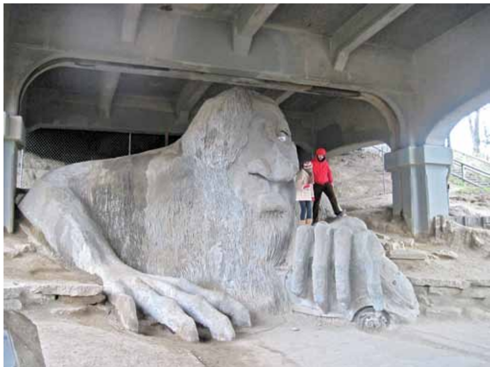
Троль пад фатальным мостам «Аўрора».

Ёсць і такія, што засталіся ў ЗША, калі ездзілі студэнтамі на заробкі ў Штаты. Потым атрымалі тут адукацыю. Многіх заняло ветрам менавіта ў Сіэтл.