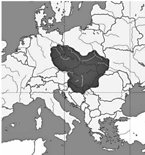
Вялікая Маравія. Тут славянская мова стала сакральнай.

Мова, створаная Кірылам і Мяфодам, якая так паўплывала на этнакультурнае развіццё народаў Цэнтральнай, Паўднёва-Усходняй