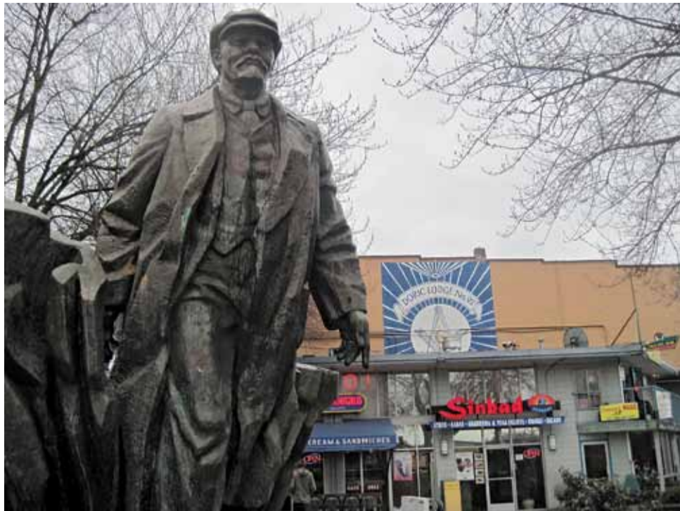
Ільч з Фэрмонта. Часам яго тут пераапрабуюць трансвестытам.

Другую вялікую частку складае эміграцыя рэлігійная. У Сіэтл едуць беларускія пратэстанты. У іх працуе ўзаемавыручка. З'язджае адзін і спрабуе перацягнуць за сабой астатніх.