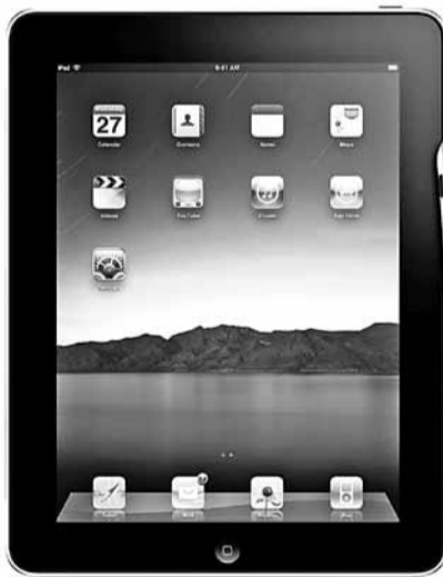
iPad 2 прадаецца хутчэй за першы варыянт.