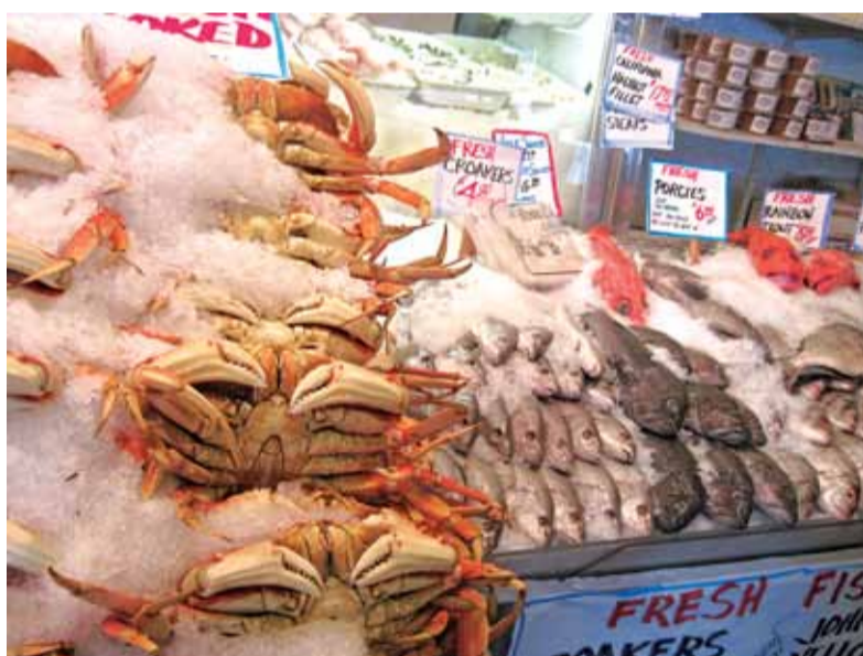
Хтосьці крабаў бароніць, але большасць ёсць.