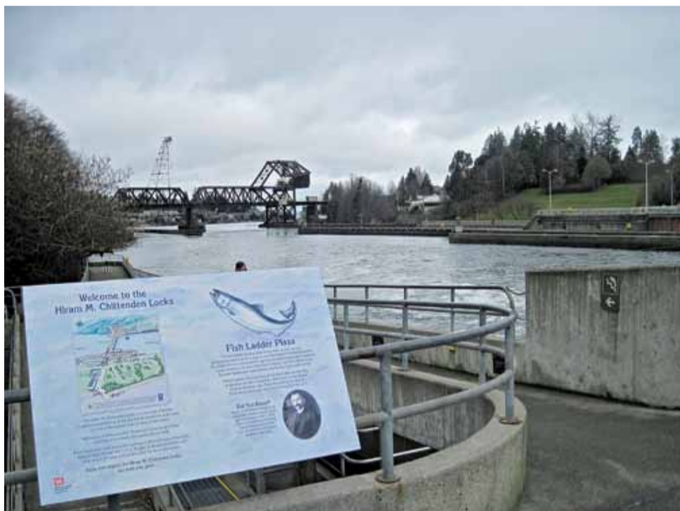
Ласось у Сіэтле — як бульба ў Беларусі.