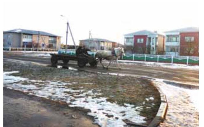
Хоць калгас і мільярдэр, але на бензіне эканоміць.

Ён дадае, што выратаваць беларускую вёску можна толькі стварэннем новых працоўных месцаў. «У нашую Тамашоўку сёння прыязджаюць працаваць нават з Брэста, кожны дзень атобус прывозіць 20 супрацоўнікаў. Я ўжо не кажу пра суседнія вёскі! Ёсць і замежныя работнікі. Актыўна пры-