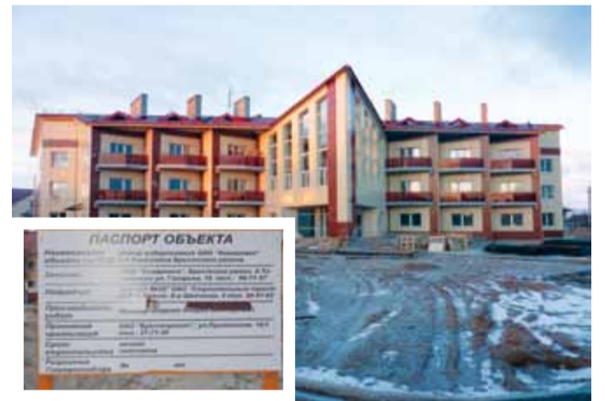
У вёсцы будуць новы аздараўленчы цэнтр.