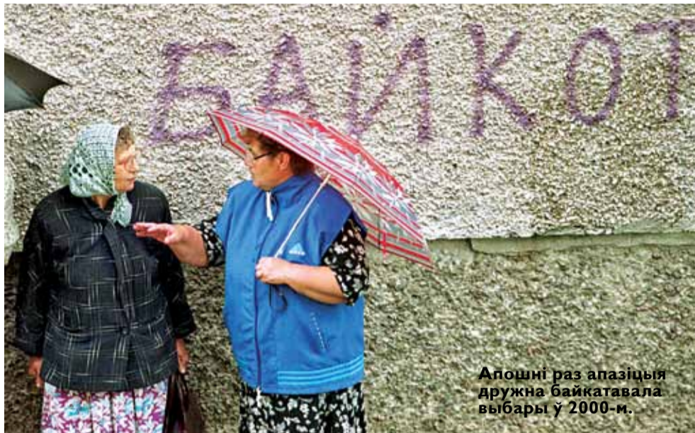
Апошні раз апазіцыя дужна байкатавала выбары ў 2000-м.

Палітыкі прызнаюць, што «самыя сур'езныя апоры рэжыму, міліцыя і спецслужбы» падтрымлівалі яго 19 снежня верна. І спадзяюцца, што грамадскае непадпарадкаванне будзе ўплываць на іх.