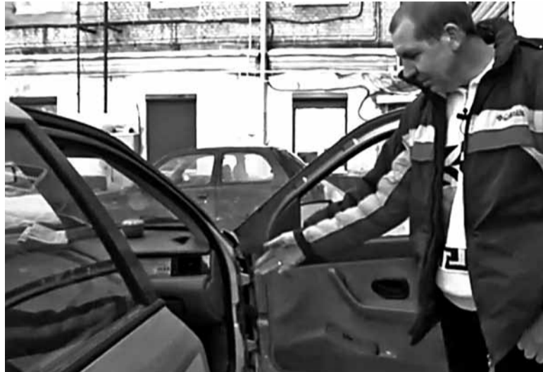
Аляксандр дэманструе журналістам іржавыя парогі новага «Саманда».

Калі пытанне пра падушку бяспекі задалі адміністрацыі сайта кампаніі «Юнісон», якая займаецца вытворчасцю «Саманда», прыйшоў такі адказ: «У «Саманда» вельмі трывалы корпус, спадзяёмся, што ў выпадку ДТЗ з нашымі кліентамі