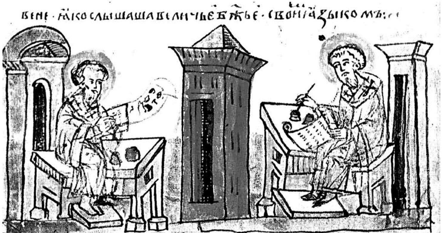
Кірыл і Мяфод перакладаюць кнігі на славянскую мову. Мініяюра з Радзівілаўскага летапісу (XV ст.).

і Усходняй Еўропы, у навуковай традыцыі атрымала назву «стараславянскай». Самі ж салунскія браты называлі яе «славенскай».