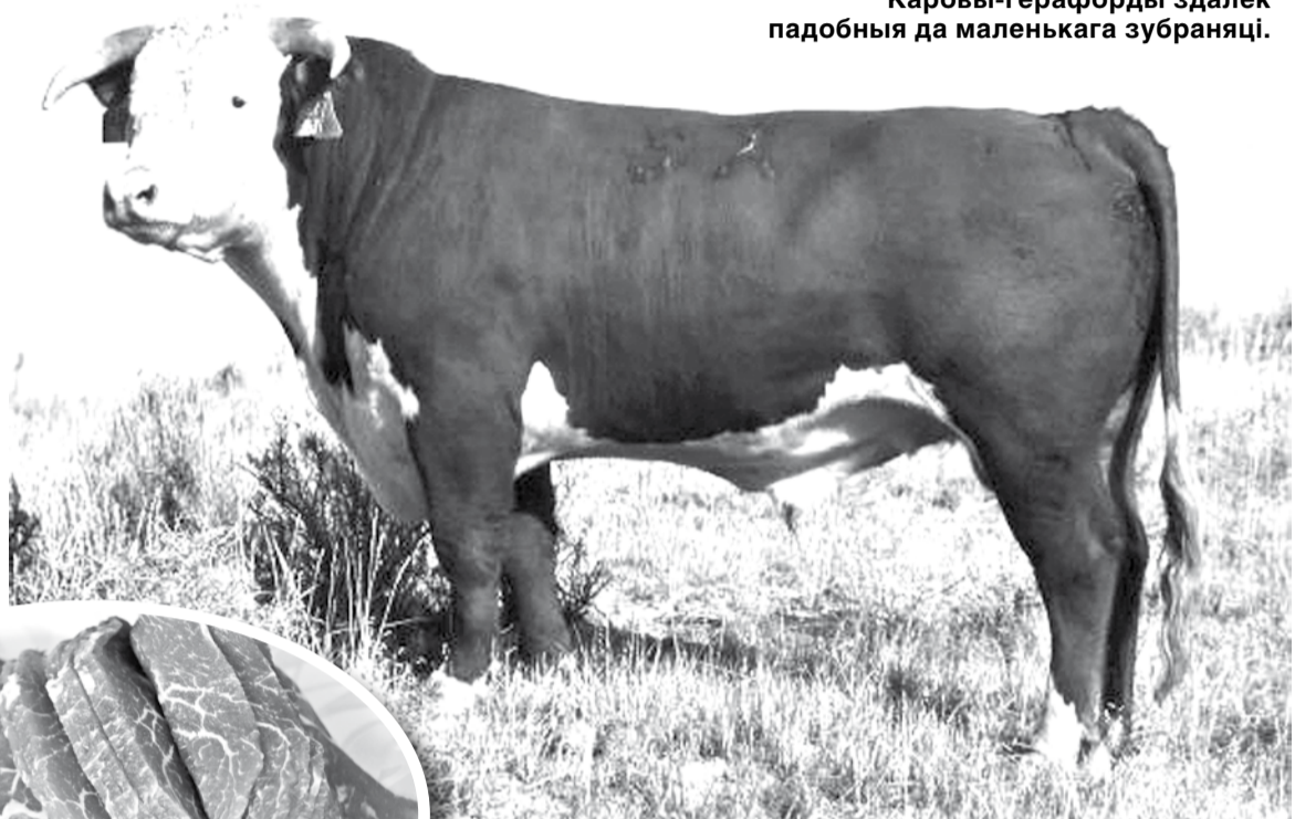
Каровы-герафорды здалёк падобныя да маленькага зубраняці.

Прычым адна з гаспадарак, «Дубовы лог», працуе намяжы з Чарнобыльскай зонай. А вось на поўначы Беларусі найбольш шых поспехаў дасягнулі ў ЗАТ «Ліпаўцы» ў пасёлку Шапечына ў Віцебскім раёне. Яго дырэктар Фазулі Гасанаў яшчэ на пачатку 2000-х закупіў некалькі дзясяткаў жывёлаў з Расіі і Венгрыі. Цяпер статак герафордаў складае там больш за 800 галоваў і выйшаў на добрую рэнтабельнасць. Цяпер у «Ліпаўцы» возаць на экскурсіі кіраўнікоў суседніх гаспадарак.