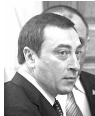
Мікалай Снапкоў пераехаў у Мінск з Магілёва.

Міністр эканомікі Мікалай Снапкоў зарабляе $750 у месяц. Пра гэта ён паведаміў 13 красавіка падчас прамой лініі, арганізаванай газетай «Рэспубліка». Адказваючы на пытанне сайта Onliner.by, міністр эканомікі адзначыў, што яго заробак «не моцна адрозніваецца ад заробку большасці беларусаў» (праўда, як высветлілася, зарабляе ён каля 6 мільёнаў