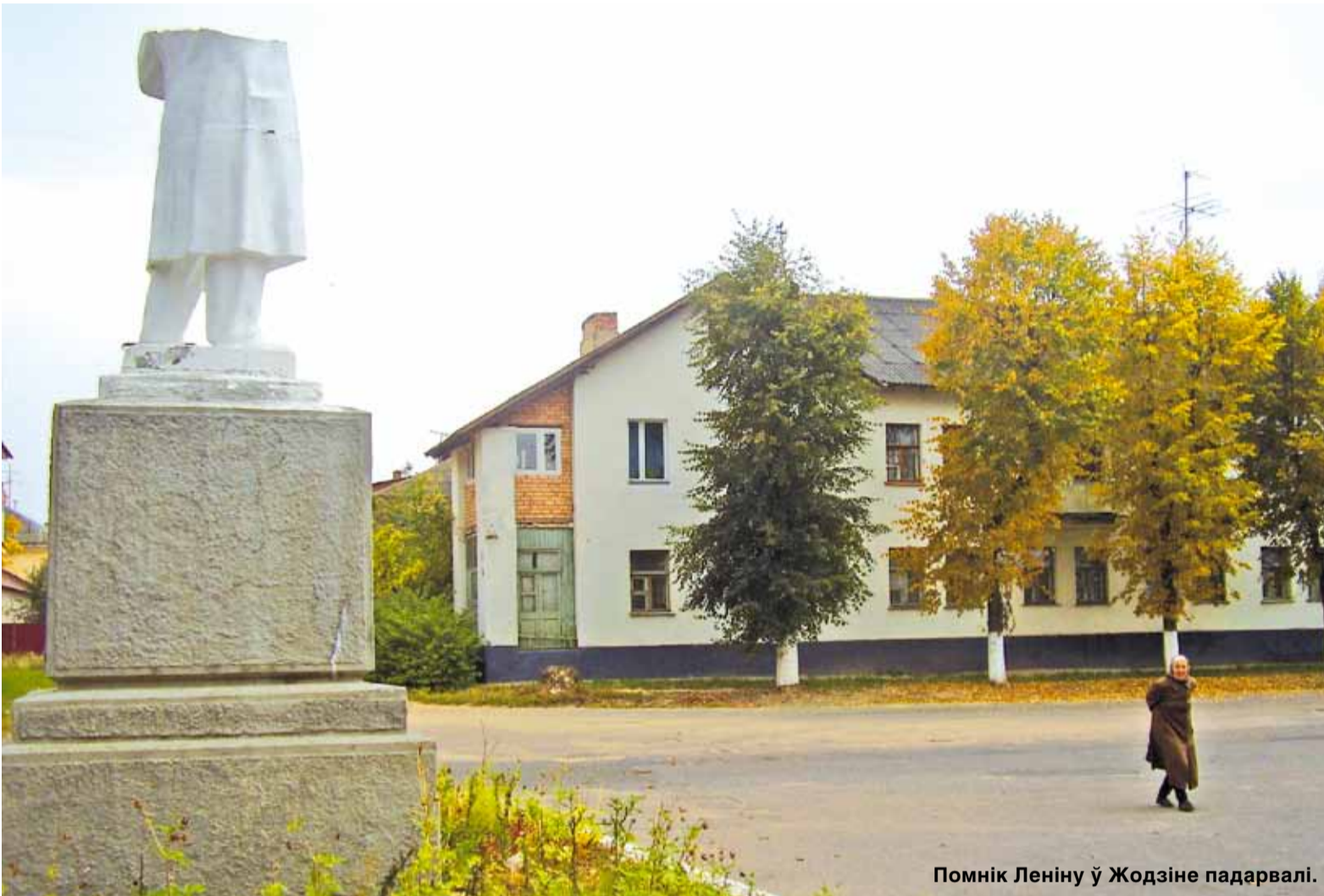
Помнік Леніну ў Жодзіне падарвалі.

Гіпсавы Ільіч узіраўся ў вітрыну вясковай крамы да 2010-га, калі вёска канчаткова ператварылася ў аграгарадок. Бюст аднеслі на школьны двор, а потым спісалі.