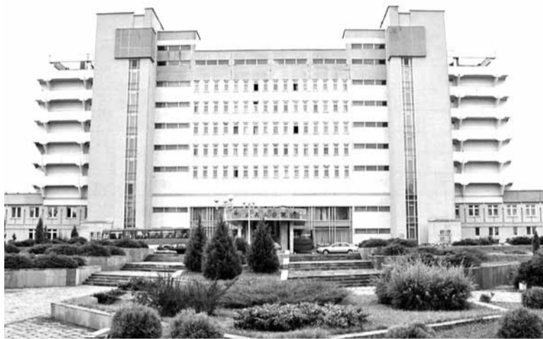
Адпачынак у «Радоне» (Дзятлаўскі раён) распісаны да верасня.