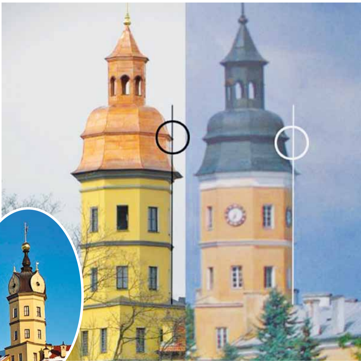
У новым купале не трапілі ў прапорцыі. На фота справа — вежа да пажару. Аднак купал з «цыбулінамі» быў увогуле не прышый кабыле хвост.