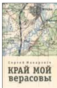
Макаравіч С. Край мой верасовы. — Мінск: Кнігазбор, 2012