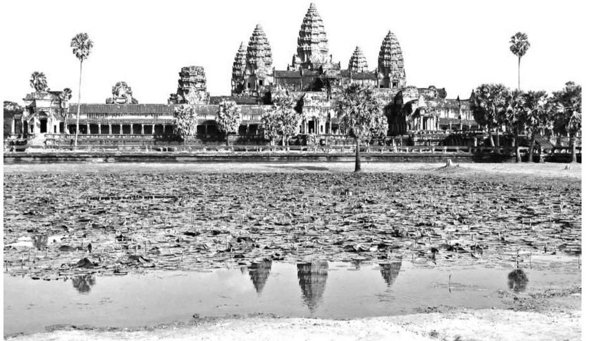
Каб паглядзець на старажытную кхмерскую сталіцу Ангкору (Камбоджа), трэба выкласці 2000 «злёных».

Што да традыцыйных кірункаў адпачынку — Украіна, Турцыя, Егіпет, — то канкурэнцыю ім пачынаюць складаць Грэцыя і Аб'яднаныя Арабскія Эміраты.