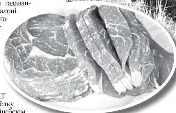
Мармуровае мяса — далікатэс ва ўсім свеце.

«Мы вымушаны закупляць мяса ў Новай Зеландыі і Аўстраліі, — кажа повар аднаго з мінскіх рэстаранаў. — Па-першае, яно больш якаснае за айчыны аналаг. Па-другое, беларускае мармуровае мяса нам не прадаюць, хоць мы былі б згодныя. Рэч у тым, што мясаперапрацоўчыя заводы прадаюць усю прадукцыю ў маскоўскія рэстараны». То бок не лішкі пастаўляюць ў Расію, як абяцаў Лукашэнка, а лішкі ад непарада-