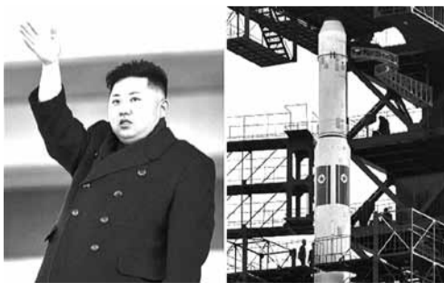
Дынастычнай Карэяй кіруе Кім Чон Ын — унук Кім Ір Сэна.

Паўночнакарэйская ракета, на якой Пхеньян абяцаў даставіць на арбіту штучны спадарожнік Зямлі, развалілася праз хвіліну пасля запуску. За пускам ракеты сачылі служ-