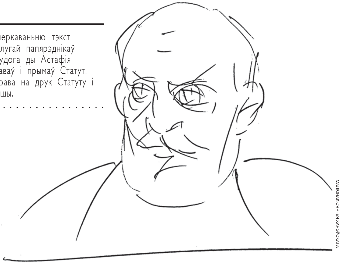
МАЛЮНАК СЯРГЕЯ ХАРЭЎСКАГА

Пасталеўшы, Л.Сапега стаў сапраўдным патрыярхам палітыкі і дзяржаўнай службы ВКЛ. Кароткі аповед пра гэтую асобу хачу закончыць цытатай з «Успамінаў» Альбрэхта Станіслава Радзівіла пра эпизод з прыездом караля ў Вільню: «Вартым здзіўленьня было бачыць 80-гадовага дзядка, які на кані гарцаваў з гетманскай булавой перад каралём; ужо спархнелая старасьць трымалася з апошніх высіл-