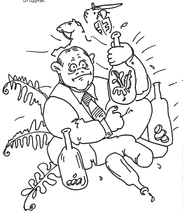
МАЛЮНАК СЯРГЕЯ ХАРАШКАГА

Хцівец. Кланяюсь узаемна. Чорт. Рады запазнацца. Хцівец. І мне тэж прыемна. Хто ж такі пан будзе? Чорт. Няўжо ж не пазнаўшы? Хцівец. Я трохі зьялкаўся. Шчэ не ачуняўшы. Чорт. Ды я не тутэйшы. Камэрсант. Здалёку. Душы закупаю для пана штороку. Хцівец. А ваш пан багаты? Ці дорага плаціць? Чорт. Іх... Слухай, мільёны ён на гэта траціць. Яму трэскі грошы, а грошы — што трэскі. Усякага купіць, абы толькі кепскі. Хцівец. А я — ці ня мог бы прадацца вашэці, Каб быў я багатшы ад усіх на сьвеце? Чорт. Можна. Вельмі проста. А чаму ж няможна? Цераз майго пана — нігды не парожна. Пры сабе ня маю, але вунь у пушчы Ляжыць скарб заклятых за ройстам* у гушчы. А там, на засьценку, ёсьць ведзьма старая. Скажа, як браць скарбы, — яна усё знае. Ну, дык згодны? Хцівец. Згодны.