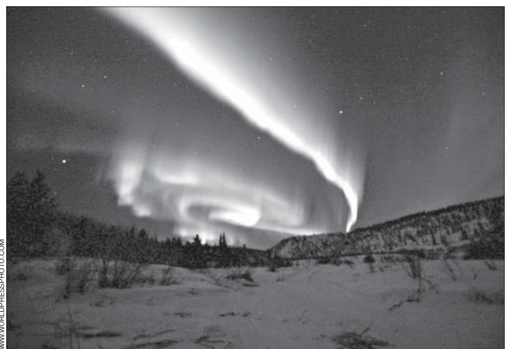
Паўночнае зьяньне над возерам Коал у Юкане (Канада). Фота Эрыка Травэrsa (Францыя). Трэцяе месца на сусьветным конкурсе World Press Photo 2005 у катэгорыі «Прырода».

За беды роднае краіны, Каб Бог ёй шчасьця, сілаў даў, Малецеся сьлязою адзінай, Каб дараваў, каб дараваў.