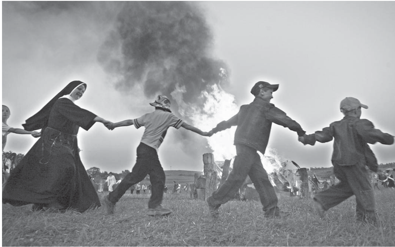
КАРАГОД вакол купальскага вогнішча завабіў нават манашку. Вёска Мосар, Глыбоччына.

Хамства на дарогах даўно зрабілася неад'емнай часткай беларускага ладу жыцця. Але прычым тут дарогі? Хамства пануе ўсюды, то чаму менавіта на дарогах яно мусіць саступаць? Калі б я быў правадыром нацыяналістаў, абвясціў бы кампанію за ветлівасць на дарогах. Маўляў, сапраўдны беларус за рулём паводзіць сябе выключна па-рыцарску, нават калі ня слухае ў дадзены момант «Легенды Вялікага Княства» і ня можа назваць імёны ўсіх польных гетманаў ВКЛ. І нават прыдумаў бы гэтай кампаніі эмблему — што-небудзь аўтамабільна-гальянтна-шляхетна-ліцьвінскае, з колерамі нацыянальнага сьцягу. І які-небудзь кодэкс прыстойных паводзінаў, і прывітальны жэст: «Мы з табой адной KRYWI!» Але ці ня дзеля таго й спатрэбілася новыя правілы, каб прадухіліць гэтыя панскія выборкі? Кажуць, што ня будзе дазволена ўдзел у дарожным руху транспартным сродкам са зьмяненямі рэгістрацыйных знакаў, маркіровак кузава, шасі і рамы, калі гэтыя зьмяненні не зарэгістраваны ў адпаведным парадку. Дон Кіхот не прайшоў бы рэгістрацыі ў беларускай ДАІ і ня змог бы выехаць на нашы дарогі па свае бесьсьмяротныя подзьвігі. Хай ведае: гэтая краіна — для Санча Пансы.