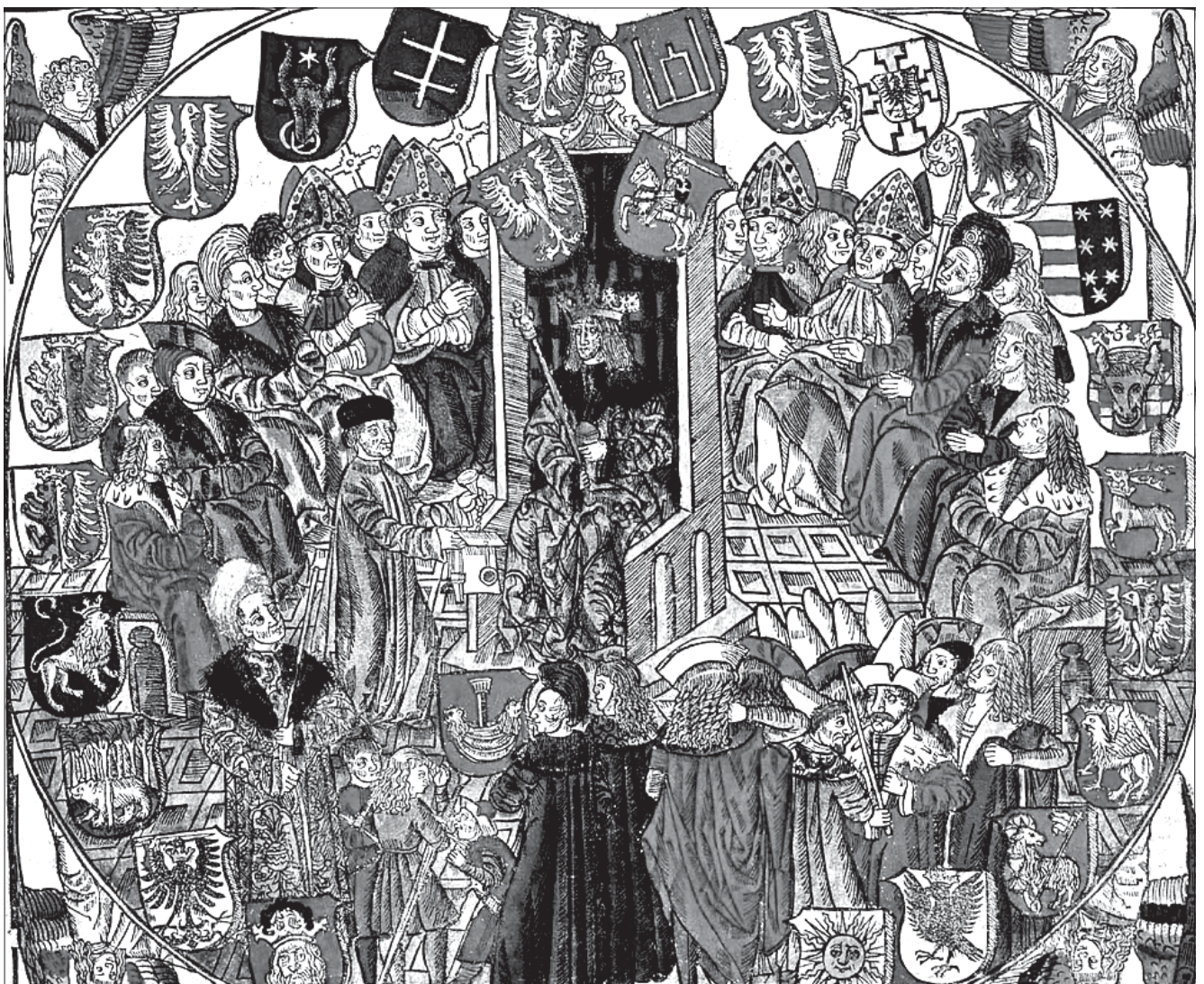
Сойм Рэчы Паспалітай. З шляецкай нацыі не нарадзілася палітычная ліцьвінская нацыя.

Ніндарф, Матыяс. Вялікае Княства Літоўскае, 1569—1795. Штудыі да ўтварэньня нацыі ў раннім Новым часе (1569—1795) . — Висбадэн: Harrassowitz Verlag, 2006. — 329 S. (Публікацыі Паўночна-Ўсходняга Інстытуту. Том 3).