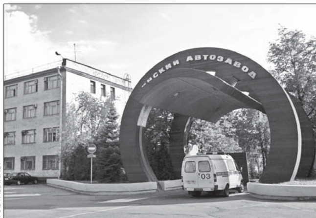
Менскі аўтазавод таксама рыхтуецца да прыватызацыі.