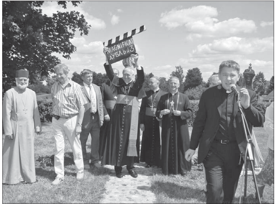
Фэстываль адкрывае апостальскі нунцый Марцін Відавіч.

Была і незвычайная прэм'ера. Стужку «Чары прыроды. У лесе» зняў ксёндз Казімер Сьвентак — калі яшчэ быў протым пробашчам пінскага касцёлу.