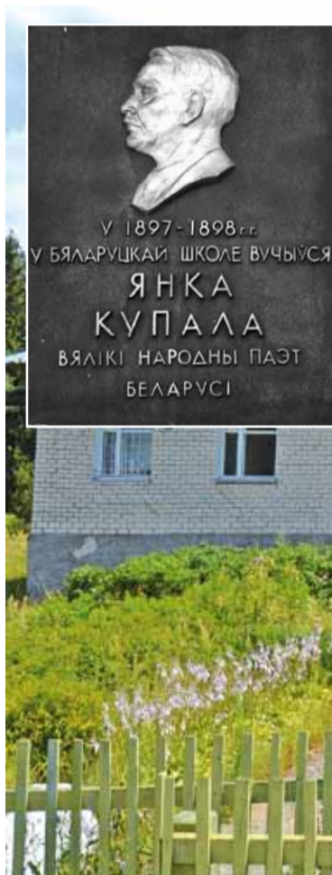
Яшчэ маўтара мясяца Бяларучкая базавая школа будзе працаваць.

У вайну драўляны будынак школы згарэў, таму па сканчэнні Другой сусветнай вайны было вырашана пабудаваць новую школу, якая атрымала імя Янкі Купалы. Неўзабаве ў ёй быў створаны музей песняра, а каля ўваходу з'явілася мемарыяльная дошка. Аднапавярховы цагляны будынак з недарэчным цяпер транспарантам «Сардэчна запрашаем» усё яшчэ выглядае дагледжаным. Некалькі класаў, спортзал і сталоўка. За будын-