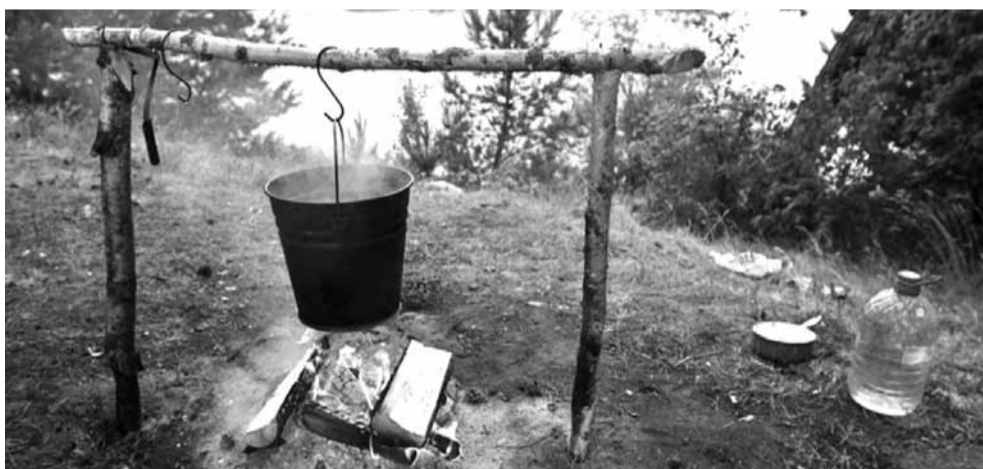
Паходная кухня падчас падарожжа.

Пра водныя паходы агенцтва «Кола падарожжаў» можна прачытаць на сайце http://bytur.by