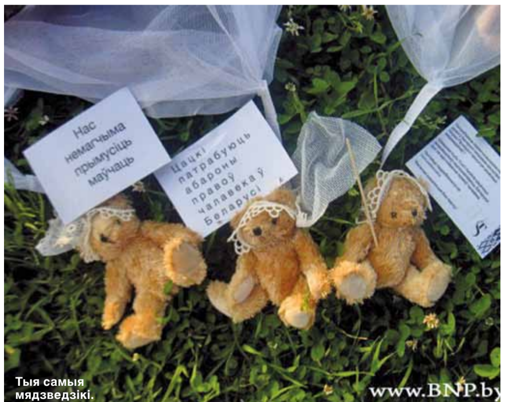
Тыя самыя мядзведзікі.