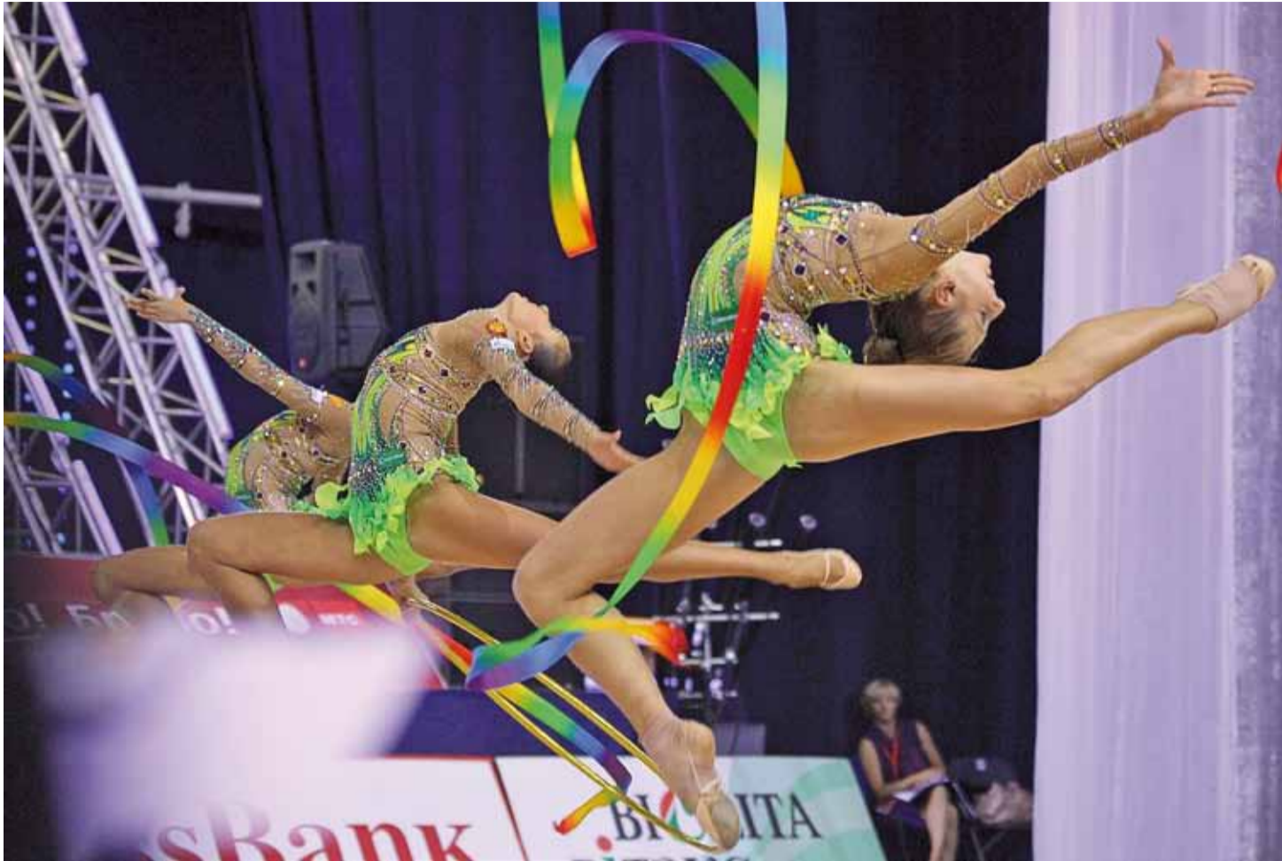
У Мінску прайшоў Кубак свету па мастацкай гімнастыцы. У гэтым відзе спорту (ці мастацтва) маем добрыя шанцы на Алімпіядзе.