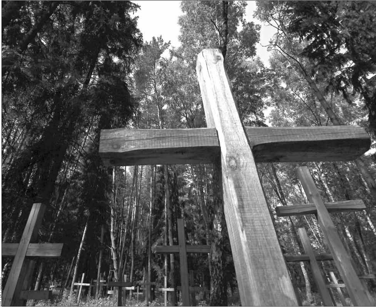
Крыжы ў Курапатах.

Іван Мележ, пішучы ў «Подыху навалніцы» пра сесію ЦВК у лістападзе 1929, глядзеў на кіраўніка ўрада БССР вачамі свайго ўлюбёнага героя Апейкі: «Хударлявы, з рэзкімі валявымі рысамі, Галадзед сядзеў з боку стала, блізка да трыбуны; ён энергічна ўстаў, пад воплескі залы ступіў к трыбуне лёгкаю і пругкаю ходою вайсковага. У яго і пастава была пра-