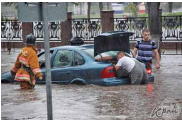
Маладзечна ледзь не пайшло пад ваду. 12 ліпеня на горад абрынулася магутная залева.

Вось такую карціну можна назіраць у Грэцыі, каля найвышэйшага горнага ланцуга краіны — міфічнага Алімпа, дзе цяпер нацыянальны парк. Беларускі трактар відавочна яшчэ служыць сваім грэчаскім гаспадарам. Хуткасныя трактары МТЗ-5 МС магутнасцю ў 48 к.с. пачалі збіраць у Мінску ў 1959. Гэты экзэмпляр, які няблага захаваўся пасля 50 гадоў эксплуатацыі, можа быць найлепшай рэкламай МТЗ.