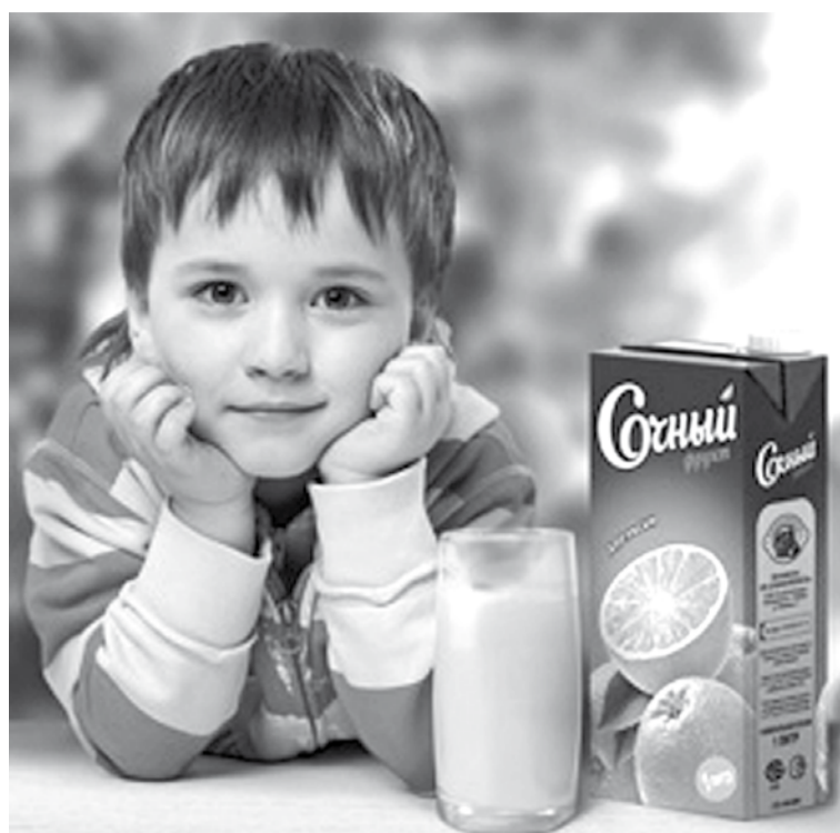
Хлопчык Улад двойчы прызнаваўся самым паспяховым рэкламным брэндам краіны.

У нектарах мінімальна маса пладовай часткі складае ад 25% (бананавы, манга) да 50% (яблычны, апельсінавы, персікавы, ананасавы і іншыя). У соках з цукрам — як мінімум 85%. У натуральных соках пладовая частка складае 100%.