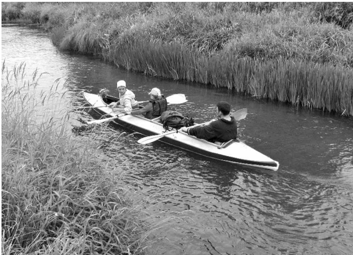
Іслач. Ад берага да берага — рукой падаць.