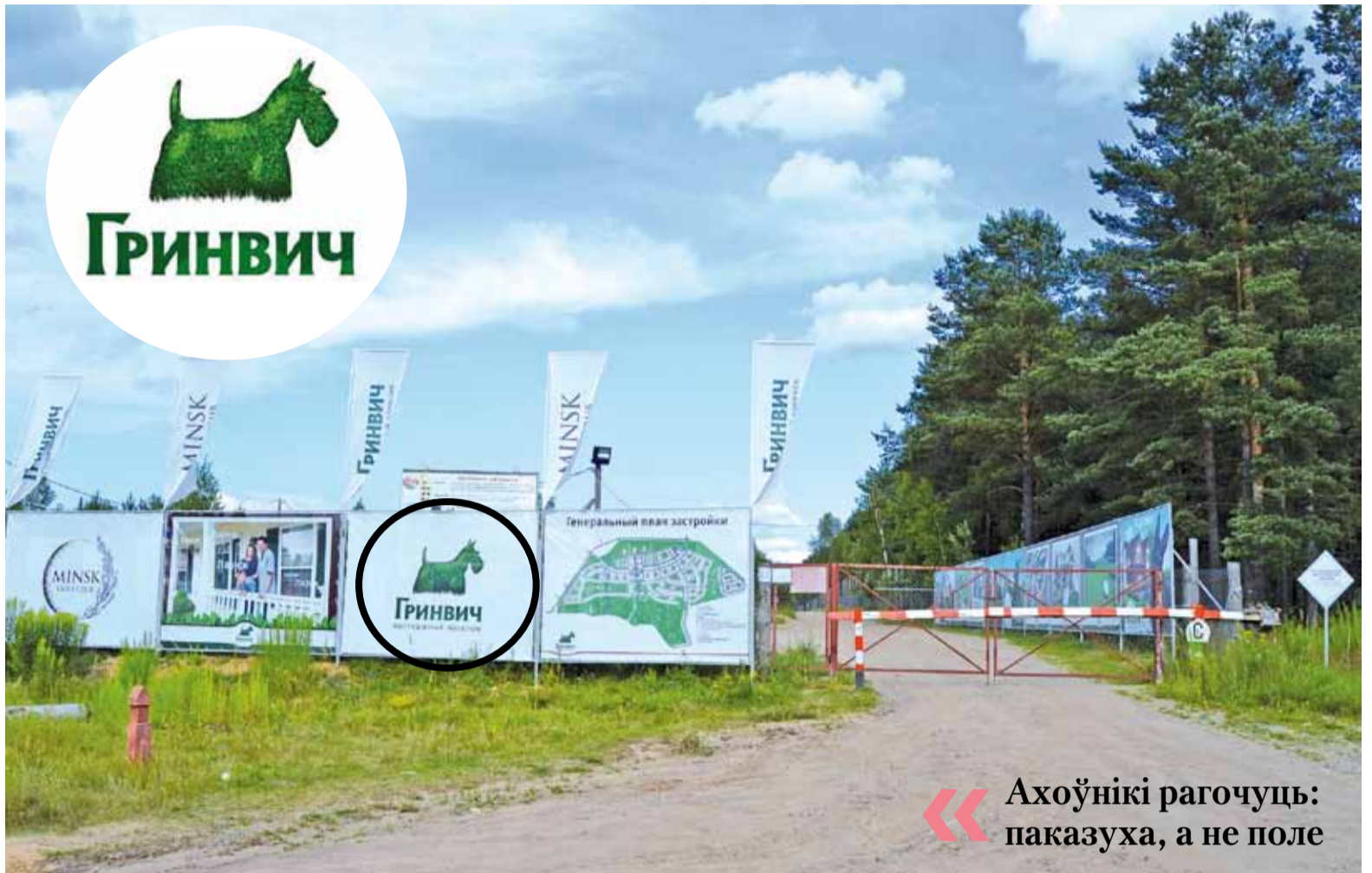
Так пакуль выглядае першы беларускі гольф-клуб.

Гольф-клуб на доўгі час знік з навінных стужак, пакуль у канцы 2011 не было ўрачыста аб'яўлена — першае маленькае поле гатовае для гульні. Спецыялісты тады пасмяяліся: хто адкрывае поле позняй восенню? А ў маі 2012 гольф-клуб трапіў у зводкі здарэнняў — на месцы будаўніцтва знайшлі баявую міну часоў Вялікай Айчыннай вайны.