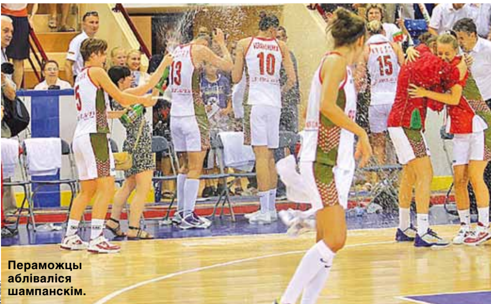
Пераможцы абліваліся шампанскім.