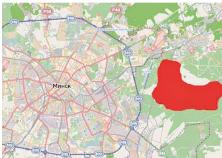
На выдзеленай плошчы пабудуюць і «Зялёны бор», і «Грынвіч», і «Нотынгем».

Тым часам забудовшчык вырашыў назваць свой раён «Грынвіч» — як англійскі горад. У ім будзе 66 катэджаў, гатэль, рэстаран, акадэмія гольфа і некалькі крамаў.