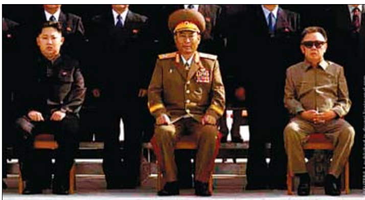
Упершыню карэйскі дыктатар Кім Чэн Ір (справа) паказаў СМІ свайго меркаванага пераемніка. 27-гадовы Кім Чэн Ын — на фота злева. Ён падобны да дзеда — Кім Ір Сена.