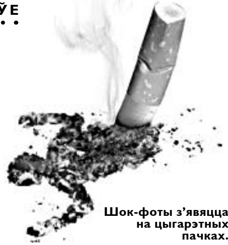
Шок-фоты з'яўца на цыгарэтных пачках.