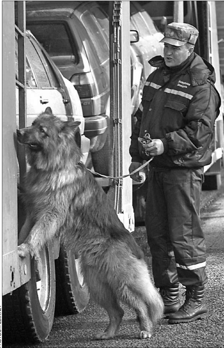
Пакуль на мяжы шукаюць наркатыкі, яны трапляюць у краіну як соль для ваннаў.