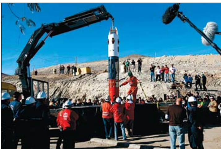
У такіх капсулах збіраюцца падымца на паверхню зямлі шахцэраў, якіх 5 жніўня заваліла на чылійскай шахце «Сан-Эстэбан». 33 чалавекі чакаюць паратунку на 700-метровай глыбіні. Дастаць іх змогуць у лістападзе, пакуль перадаюць ежу.