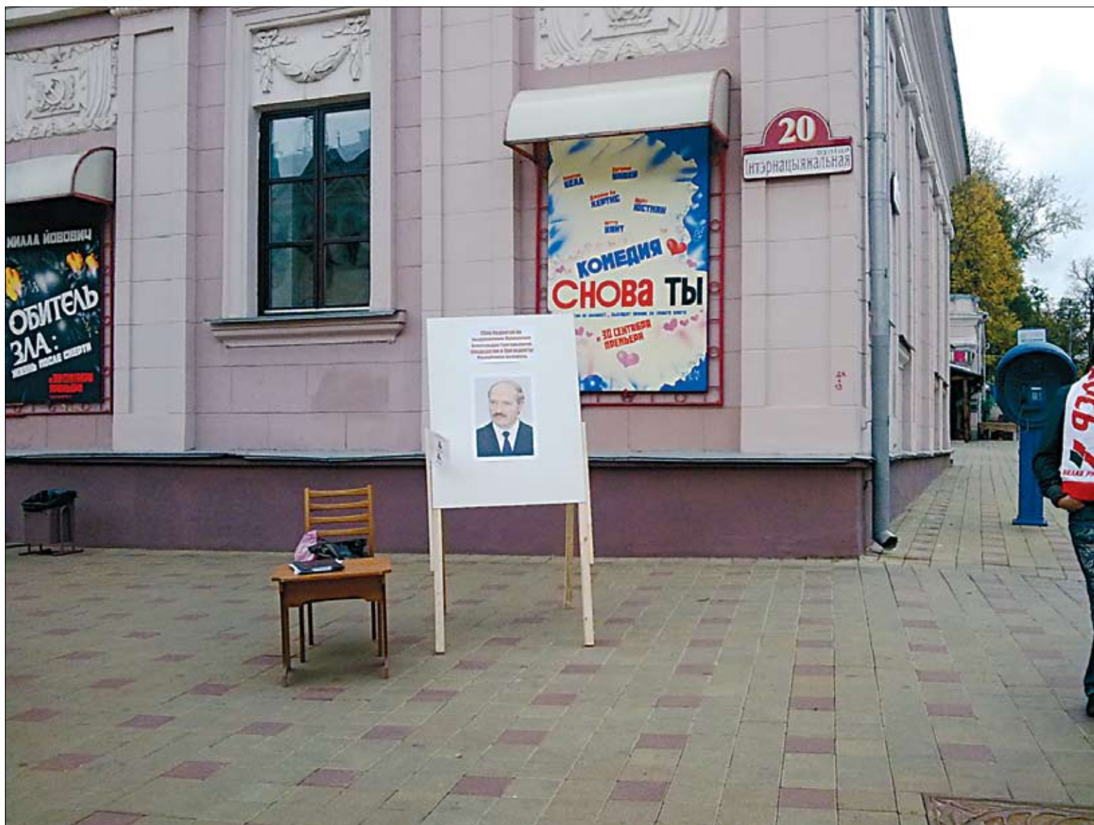
Лукашэнкаўскія пікеты ў Мінску не выклікаюць ажыятажу. Старонка 8.