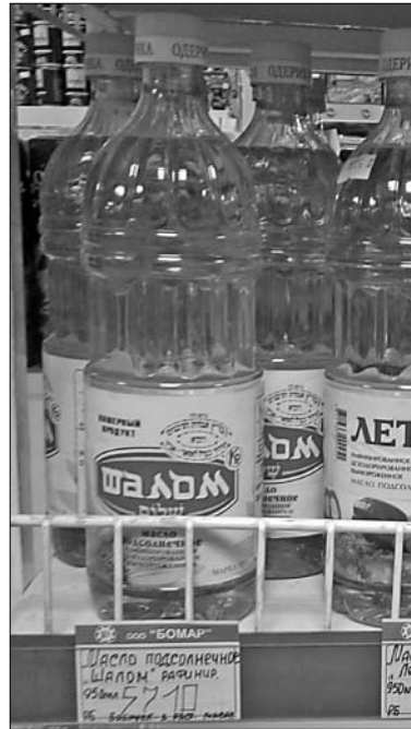
Кандыдат у пераможцы наступных гадоў — алей «Шалом».

Змрачнаватым падаўся таварны знак «Рытуальнае» ад Беларускага народнага пенсійнага фонду (па класе 36 — страхаванне, фінансавая дзейнасць, крэдытна-графовыя аперацыі і аперацыі з нерухомас-