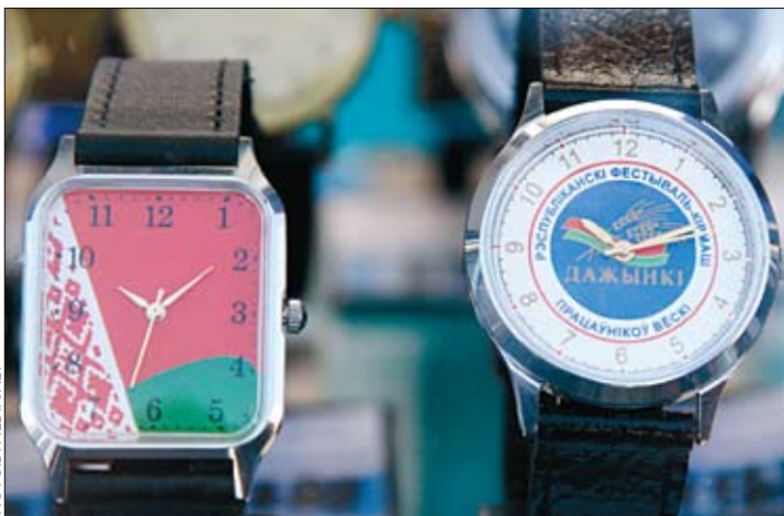
Такія калекцыйныя мадэлі выпускае Мінскі гадзіннікавы завод.