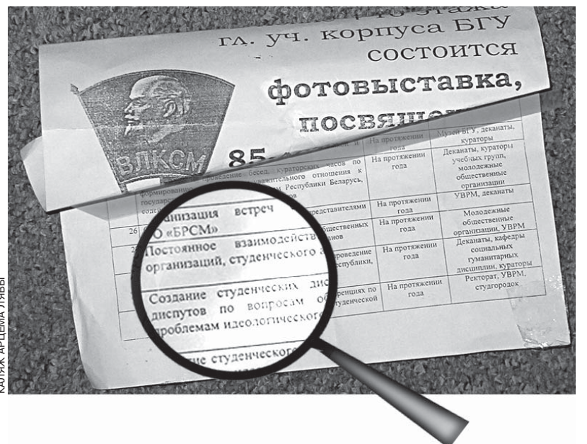
КАЛЖ АРЦЕМА ЛЯВЫ