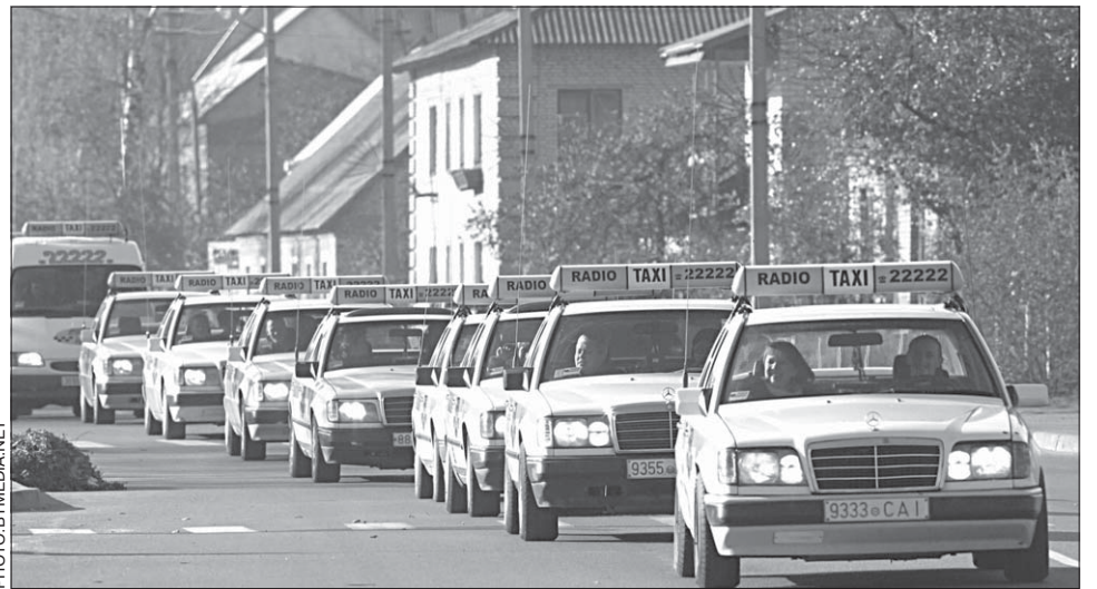
Першы кліент «Радые́таксі-22222» атрымаў бутэльку шампанскага.

Усе дзяржаўныя ўстановы падпарадкоўваюцца карным органам. Галадоўшчыкі патрабуюць вярнуць таксоўкі і даць ім магчымасьць працаваць далей. А ў гэты самы час міністар транспарту Баравы падпісвае загад: прыпыніць ліцэнзію Аўтуховіча на таксаперавозкі з 20 кастрычніка на месяц. Гэткі нож у сьпіну. Мінтрансарту пра таксоўцаў з райцэнтру насамерч і не ўспамінала, але паступіла каманда