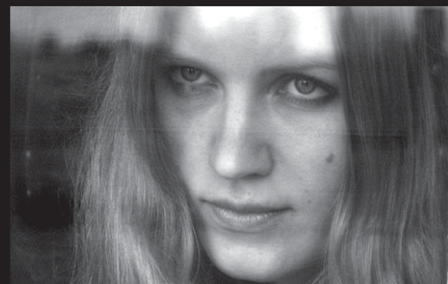
«Адам і Ева»