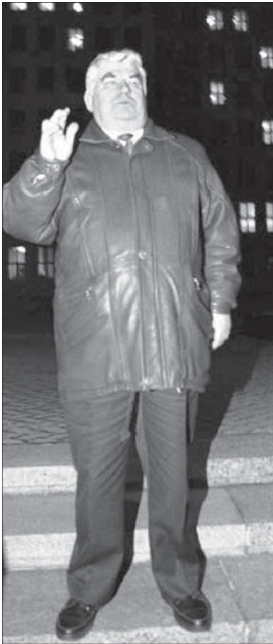
Сямён Шарэцкі, старшыня Вярхоўнага Савету XIII склікання, зьвяртаецца з заклікам разыходзіцца па хатах да людзей на пл. Незалежнасці ў Менску, што прыйшлі на абарону Вярхоўнага Савету ў лістападзе 1996.

Грузія месціцца ў геаграфічнай Азіі, за хрыбтамі Вялікага Каўказу. Азія мае спакуслівы і каўткі водар. Зямля тут пахне самавітымі пладамі сонца, а паветра настоенае на сотнях стагоддзях цывілізацыі. Гісторыя незалежнасці Грузіі сягае ажно ў антычныя часы. Гісторыя тутэйшага хрысціянства ў два разы даўжэйшая за нашу. Першае яскравае адрозненне тутэйшага палітычнага жыцця ад нашага — нацыянальнае самавызначэнне. Яшчэ ў савецкія часы тутака панаваў культ сваіх цароў, якім ставіліся сацрэлістычныя помнікі. Ніводзін з грузінскіх палітыкаў ніколі не сумняваўся ў самадастатковасці Грузіі і велічы яе культуры. Уявіць сабе, што Шэварднадзе стаў бы кпіць з грузінскае мовы, як Лукашэнка зь беларускай... проста нерэальна. Хоць і Лукашэнка гаворыць па-расейску з моцным акцэнтам.